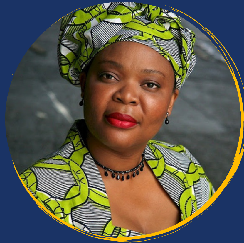
Leymag Gbowee (laureada com o Prémio Nobel da Paz)