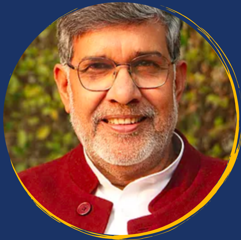
Kailash Satyarthi (laureado com o Prémio Nobel da Paz)